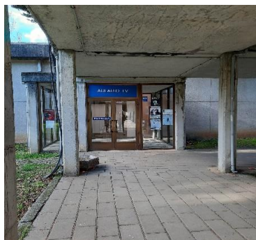
AULARIO 4 Aula 7 Aula 14